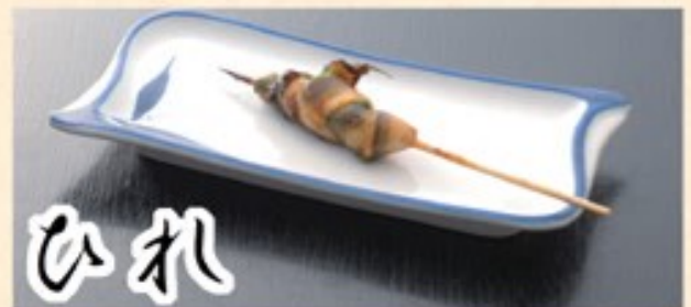
うなぎの背びれのニラ巻き