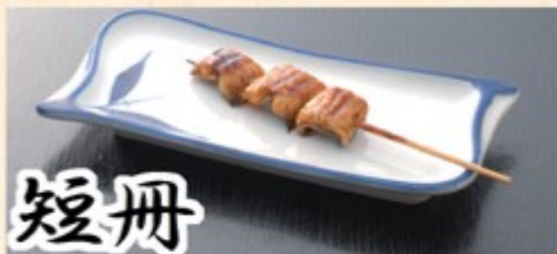
蒲焼を小さく短冊に