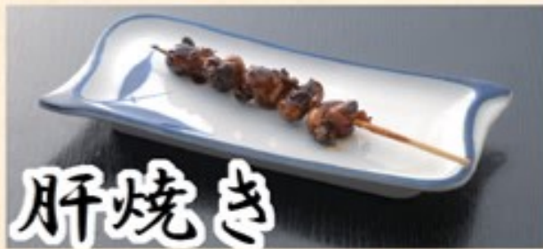
うなぎの肝をタレ焼きで