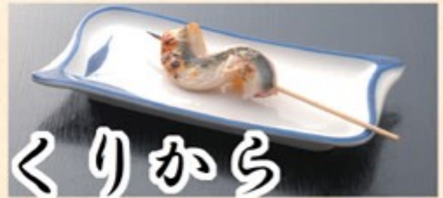
うなぎのはら身をわさび醤油で