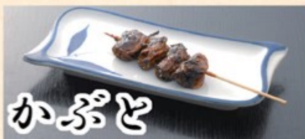
うなぎの頭の魔法蒸し 二二〇円