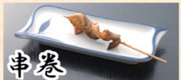
細身のうなぎの尾を醤油焼きで