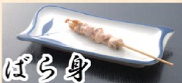
うなぎのアバラ身を塩焼きで